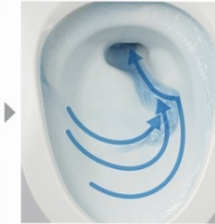
流れの方向を変え、一気に流しきる。

※1 約20年前の当社サイホンセット式トイレ(CH43) ※2 水圧0.2MPaの場合。その他当社基準に基づき測定。N=20台平均。