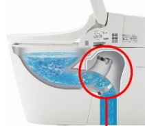
ターントラップ方式