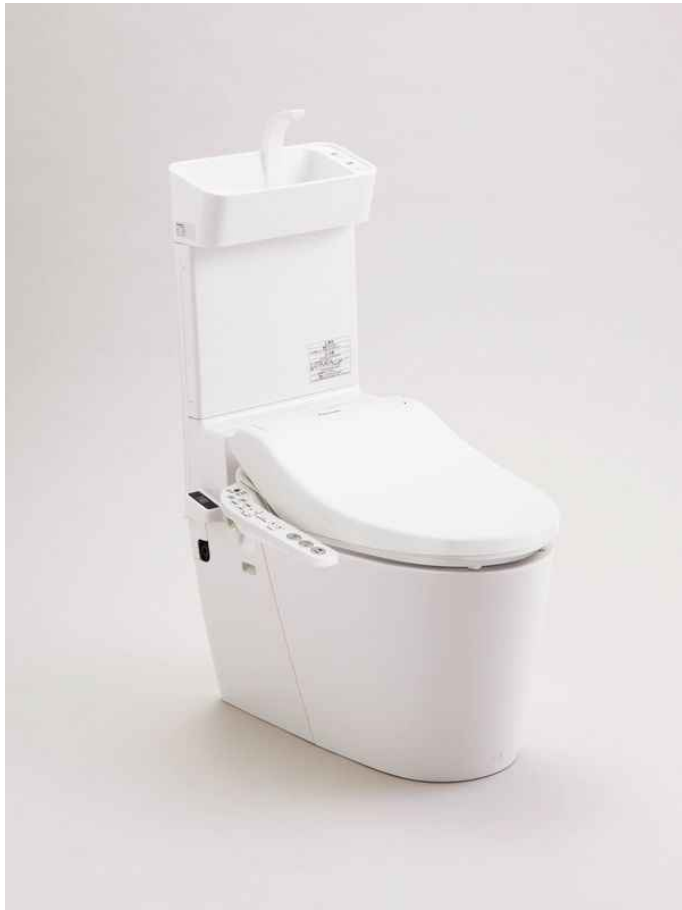
※画像はイメージです。組合せなどはお見積書をご確認ください。