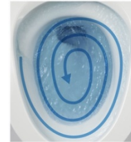
ボール全体をまんべんなく洗う。